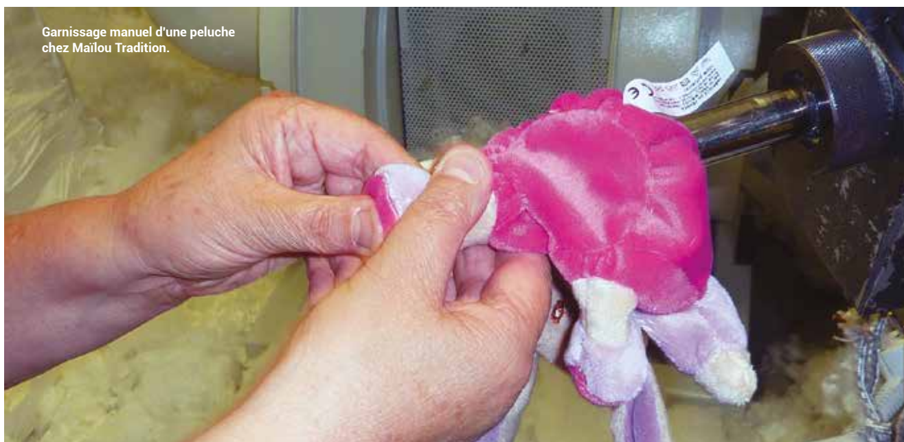
Garnissage manuel d'une peluche chez Maïlou Tradition.

Outre les jouets ou types de jouets entrés dans l'histoire comme Sophie la Girafe ou Mon Chalet en bois, un nouveau produit doit répondre à un système de classification, et des guides conçus par la Commission Européenne apportent une aide aux fabricants et concepteurs. Point important, un jouet ne doit pas être source de danger pour l'enfant qui