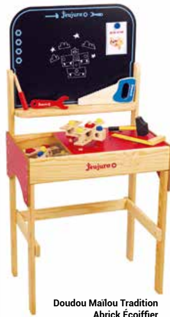
Doudou Mailou Tradition Abrick Écoiffier Maquette Canadair Heller Établi Jeujura